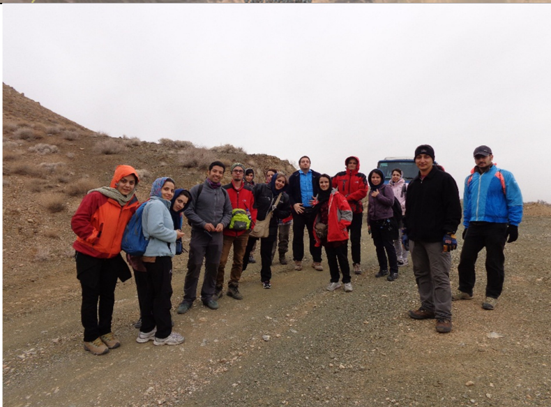
1) روستای قلعه بالا حرکت به سمت روستای دلبر