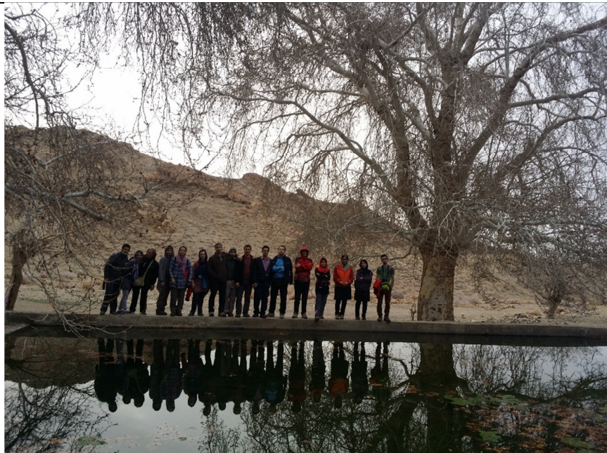
2) روستای دلبر