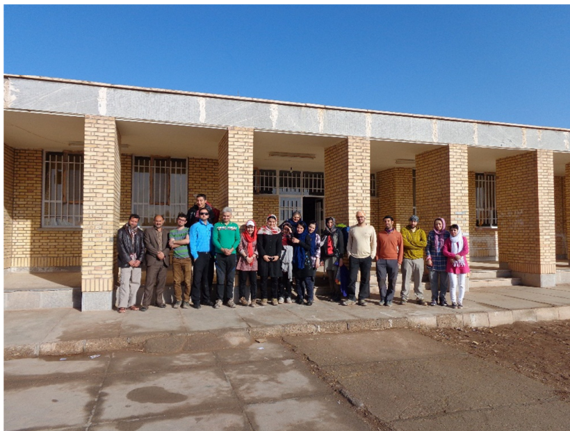
3) صبح روز سوم