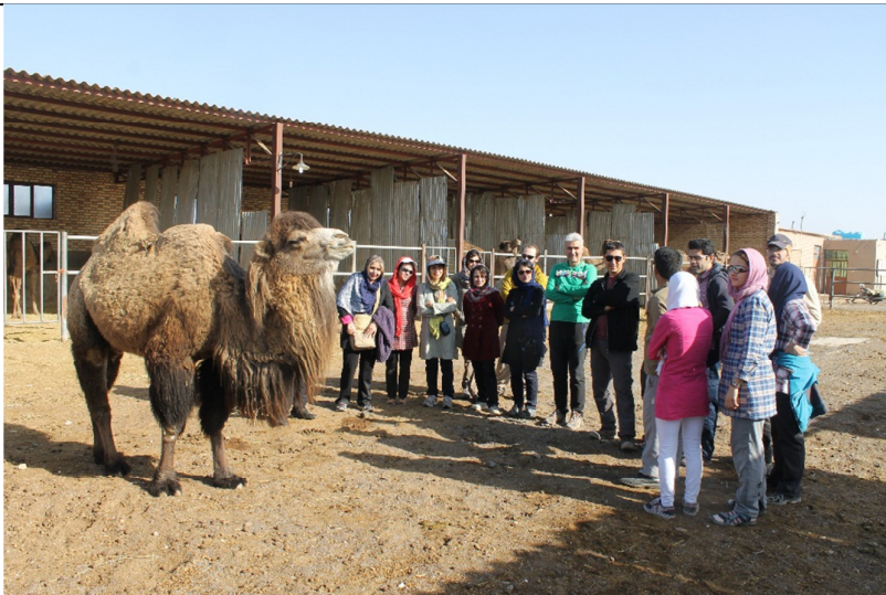
4) بازدید از مرکز بانک ژن و اصلاح نژاد شتر شرق کشور